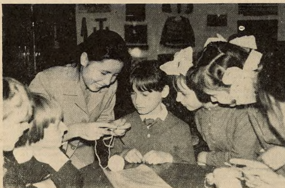
В'етнамскія студэнты БДУ з вялікай цікавасцю знаёмяцца з жыццём савецкіх дзяцей, наведваюць школы, дзіцячыя сады, палацы піянераў. Беларускія хлопчыкі і дзяўчынкі заўсёды шчыра сустракаюць маладых прадстаўнікоў гераічнага В'етнама.

НА ЗДЫМКУ: в'етнамскія студэнты ў Мінскім палацы піянераў.